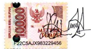
Cipto Eni Nurhedi