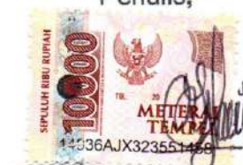
Sylvia Ayu Anggraeni