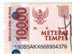
Naili Fitrotul Ummah